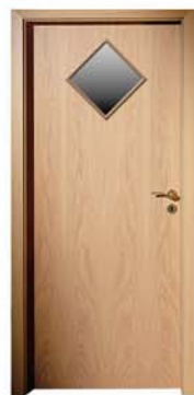
K 301 M1