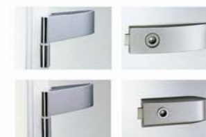
Set feronerie Arcos